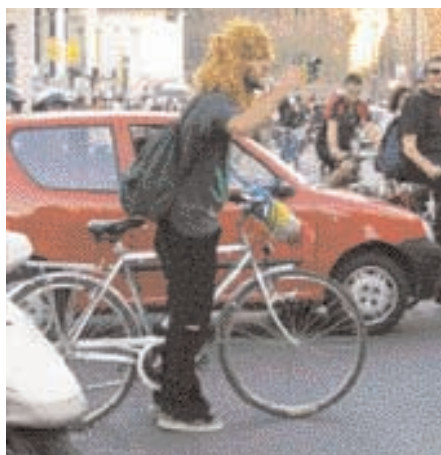
Nelle foto in queste pagine alcuni momenti della Critical Mass del 29 maggio a Roma.